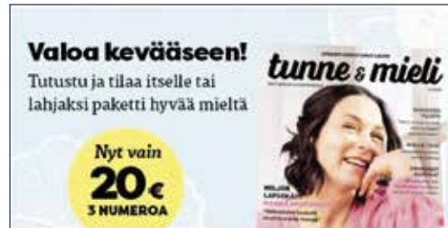
kuvan leveys 560 px, korkeus vapaa