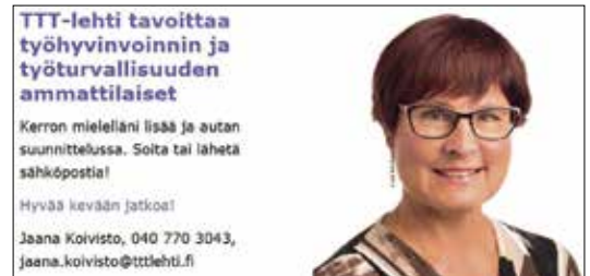
teksti n. 300 merkkiä